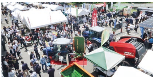
弊社主催 九州 農業WEEK(2023年)の屋外展示会場光景

展示会場を飛び出して、屋外での展示企画を初開催! 大型実機のデモンストレーションをご覧ください